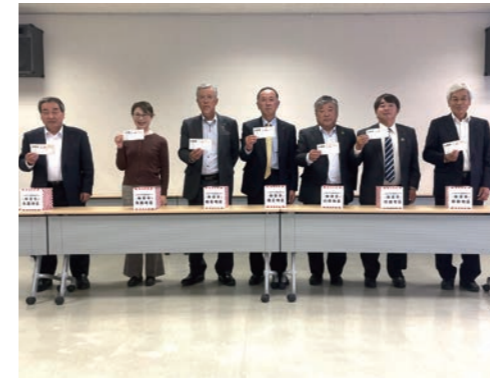
抽選を行う代表理事ら

当選者100名が決定！ 地区まつり抽選会開催 11月22日、本店2階大会議室で地区まつり抽選会を開催しました。これは10月26、27日、11月2日の3日間で仙南管内7地区にて開催された「JAみやぎ仙南地区まつり」において、広報誌などで事前に発行された応募券の投函者を対象に行われたものです。応募総数は昨年の777通を上回る1,475通。景品は、シンケンファクトリーのギフトセットで、A賞が1万円相当20名、B賞が5千円相当30名、C賞が3千円相当50名、計100名。7地区の代表理事により厳正なる抽選を行い、100名の当選者が決まりました。