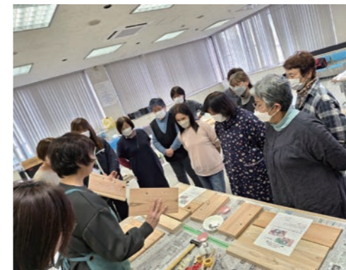
先生の説明を聞く参加者

当選者100名が決定！ 地区まつり抽選会開催 11月22日、本店2階大会議室で地区まつり抽選会を開催しました。これは10月26、27日、11月2日の3日間で仙南管内7地区にて開催された「JAみやぎ仙南地区まつり」において、広報誌などで事前に発行された応募券の投函者を対象に行われたものです。応募総数は昨年の777通を上回る1,475通。景品は、シンケンファクトリーのギフトセットで、A賞が1万円相当20名、B賞が5千円相当30名、C賞が3千円相当50名、計100名。7地区の代表理事により厳正なる抽選を行い、100名の当選者が決まりました。