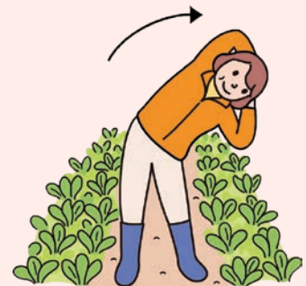
(3) 反対側も行います。体側部と腕の付け根が伸びているのを意識しましょう。