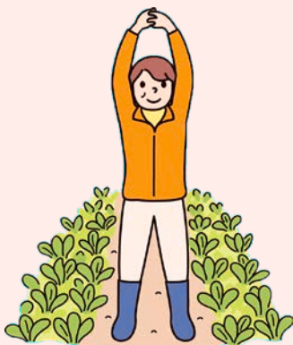
(1) 両手を握り両腕を上げて、体全体を伸ばします。

体の横（体側部）と腕の付け根の筋肉を伸ばします。野菜の収穫作業で、疲れを感じたときにお勧めです。同じ姿勢が続くと血行が悪くなり、疲労がたまりやすくなります。「畝3本分を収穫したら1回体操」というように決めておくといいでしょう。