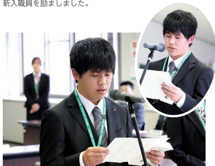
新採用職員入職式

福地課長は「農業の大切さを学ぶために活用させていただきたい」と話しました。教材は各学校での子ども達の食農教育活動に活用される事になっています。