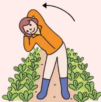
(2) 両手は頭の後ろに移動します。右手で左手を引っ張りながら、体を横に曲げます。