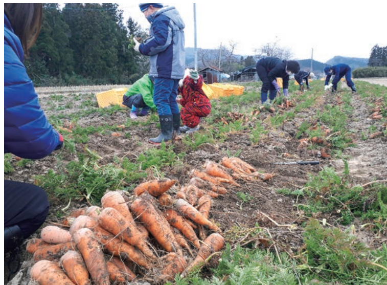
被災地支援ネギ・ニンジンの収穫

収穫したニンジンとネギは、仮設住宅で生活する被災者宅へ2kgずつ提供されました。