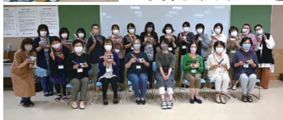
仕上がりに笑顔を見せる参加者