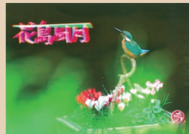
デジタル書道「花鳥月」(角田市 一炊の夢さん) スーパーモデルとして、活躍してく れるカワセミ君に「シクラメンの花」 をプレゼントしました。

ハガキにプリントしてあるのかと思 うくらい綺麗なイラストに驚きました！ うぐいすの鳴き声が聞こえる季節が 待ち遠しいですね！