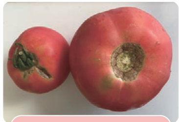
規格外のトマト

決められた大きさや形から外れた野菜は「規格外」と呼ばれ、流通させることができません。でも形も大きさもバラバラなのが自然の姿。例えば、野菜宅配の「大地を守る会」では「もったいナイシリーズ」として規格外の農産物が販売され、野菜販売サイトの「みためとあじはちがう店」では、規格外青果物を箱詰めして大田市場から直送しています。コロナ禍で「ポケットマルシェ」や「食べチョク」など、規格外を含めて生産者から直接購入できるサイトが大人気になりました。