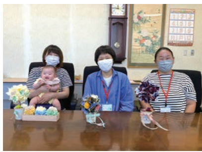
完成したトピアリーに笑顔を見せる受講生

9月22日、柴田町の本店で女性大学カレッジ輝菜里(きらり)の6期生第2回「トピアリーづくり」を開きました。 当日は4名の受講生が参加し、100円ショップで購入できる発泡スチロールのボールに、カットした布をランダムに差し込んでいく手軽に楽しめるトピアリーづくりに挑戦。今回は、持続可能なSDGsの取り組みとして布は古着を使用しました。 受講生は布の配色に悩みながらもすぐにコツをつかみ、世界に一つだけのオリジナルの作品に仕上げていました。 受講生からは「久しぶりに集中して作ることができた」「古着を使って満足する作品ができた。他の受講生と楽しく会話ができ良かった」と話しました。