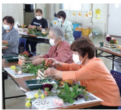
フラワーアレンジメントを楽しむ参加者

9月21日、村田地区女性部は地区事業本部で第3回目のフラワーアレンジメント教室を開きました。 今回は16名が参加し「秋の収穫」のテーマでダリア・バラ・アイビーを使い、飾り南瓜でハロウィン等のイメージで作成しました。 参加者は「テーマを設けての教室は今までと違って楽しい。花が終わってしまってもアイビーがあるので自分流で活ける楽しさもある。また器も木でできたボックス型の物を使ったのでインテリアとしても使えて一石二鳥」と喜んでいました。 次回は12月に「お正月」をテーマに教室の開催を予定しています。