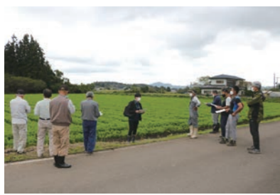
活発な意見交換を行う生産者

9月28日、みやぎ生協向けの秋冬人参を栽培する西部地区の産直生産者を集め、現地検討会を開きました。 生産者、生協担当者、JA職員ら10名が参加し、川崎町・蔵王町・白石市の圃場を巡回しました。この現地検討会は当JAでは初の取り組み。これまで交流のなかった他市町村の生産者同士で栽培方法や土壌の特徴、施肥防除などの情報共有を図り、西部地区全体の更なる品質および生産技術の向上を目的としています。 参加した生産者は「西部地区の人參の産地化へ向けて情報共有することができて良かった。今後とも生産者同士の情報交換を継続し、栽培技術の向上に努めたい」と話しました。