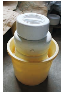
4. 下漬けで塩水が出るので、適量残し、味を調える。※下漬け約4日、本漬け約5日。