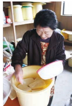
3. 切った大根を漬物樽に入れ、段ごとに塩をふりかける。