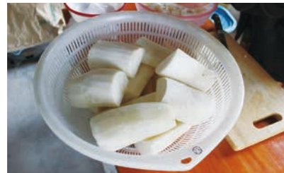
2. 長さは漬物樽に合う大きさに合わせて切る。