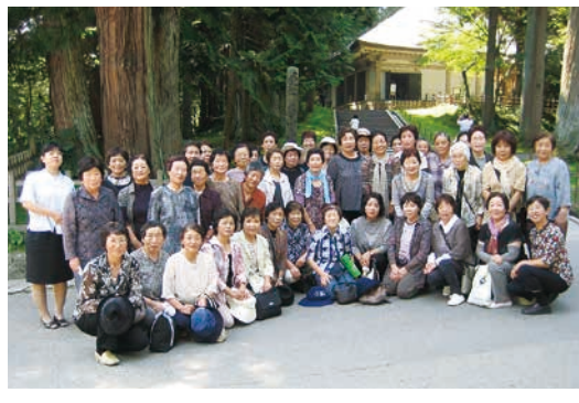
平成23年9月9日 女性部川崎地区ふれあいの旅にて

女性部川崎地区では、青年部・女性部合同で地元小学校・中学校にて、野菜の苗などの定植作業と一緒に取り組んでいるほか、収穫祭にも招待され、生徒達に食の大切さを教える食農教育活動を推進しています。