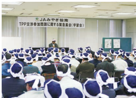
▲緊急集会には約240名が出席

集会では、組織代表からの意見発表(決意表明)や、①事前協議に臨む政府統一方針の確立。②十分かつ正確な情報開示。③公正・公平で広範な国民的議論の徹底。④国益に即した判断基準の明示。の4つを強く求める特別決議が採択され、出席者全員の拍手を持って承認されました。国民生活の様々な分野に影響を及ぼすことを踏まえ、メリットだけでなく、デメリットも含め収集した情報開示などを政府に求めて行く考えを再確認しました。採択後には、出席者全員でカンパロー三唱が行われ、「TPP交渉参加断固反対」を地域に広め、JAみやぎ仙南全体で取り組んでいきます。