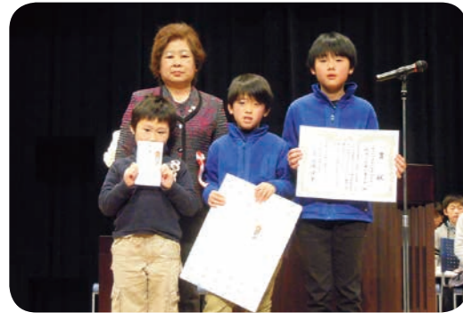
▲かべ新聞コンクールでは女性部長賞に輝きました！