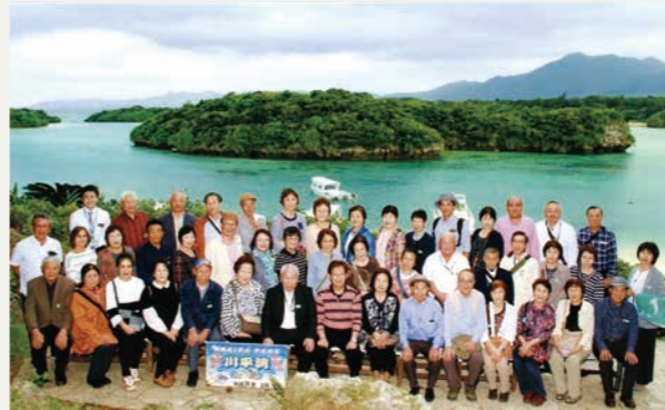
(沖縄の旅を楽しむ参加者ご一行)

JAは合併20周年記念企画の第2弾として、2月28日から3月2日まで「FDAチャーター便で行く、琉美の島久米島・亜熱帯の島々を巡る石垣島3日間」を実施しました。