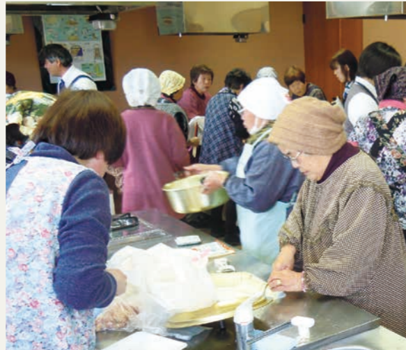
(料理を学ぶ参加者)

JAは、2月18日から3月14日まで管内7地区で、女性組合員及び地域住民の懇談会「虹色テラス」を開きました。女性目線の意見を聞くことや、JA事業をはじめ役立つ情報を提供するために開いているもので、今年度で5回目となりました。