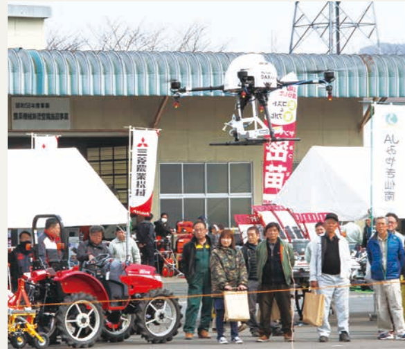
(ドローンの実演も行なわれました)

JAは3月6・7日の2日間、角田市で「営農支援フェア(営農相談会)」を開き、担い手を中心に約900人が来場しました。最新の各種営農情報の見える化を図るために実施しているもので、生産現場に即した事例の紹介や営農相談に応じました。