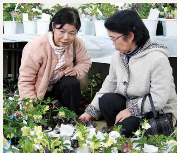
(お気に入りの一鉢を選ぶ来場者)

当日は、農政相談や農地中間管理事業、農業のITツールを紹介するブース等が設置されました。また、「だて正夢」や「金のいぶき」、業務用多収品種の「萌えみのり」や、2019年産から管内で栽培が始まる「ゆみあずさ」について栽培講習が開かれたほか、一般向けの野菜栽培講習会さらに大河原農業改良普及センターと共催で「仙南地域農業経営トップセミナー」も開かれました。