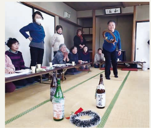
(高得点を目指し張り切る会員)

交流会では、JA宮城中央会が推進している「百歳元気プロジェクト」の「歯あわせ体操」や「いきいき体操」を行い、改めて健康寿命の大切さを確認しました。普段は地域住民や介護施設の高齢者向けにゲームや体操をしています。同日は自分たちが主役となって、一升瓶を使った輪投げで点数を競い合い大いに盛り上がりました。